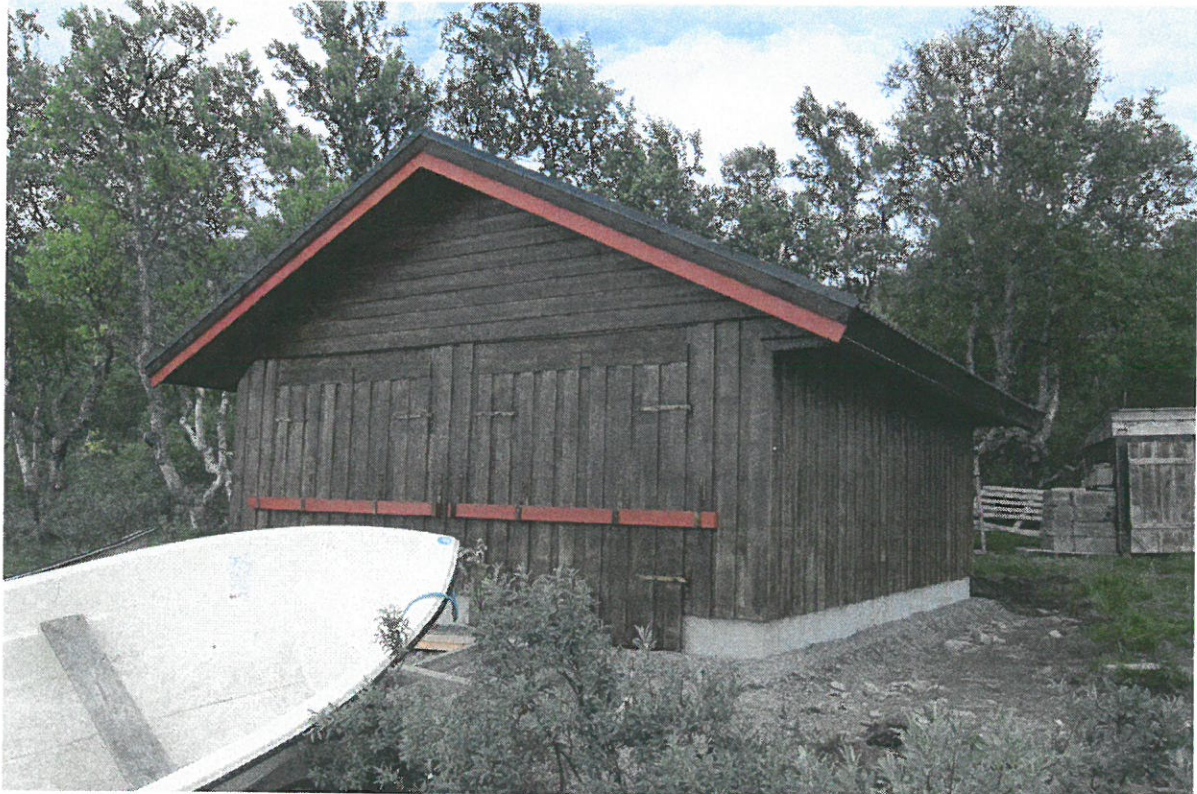
Nytt båthus ved Gusvatnet.

Fjellstyrene i Lierne SA er en felles oppsyns og administrasjonsordning for Sørli fjellstyre og Nordli fjellstyre, i Lierne kommune.