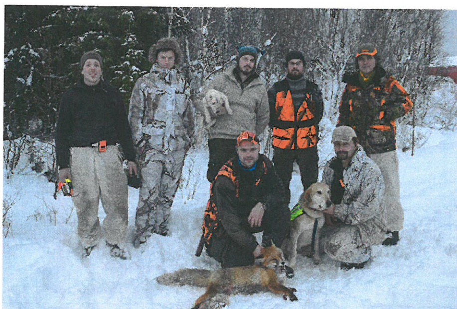
Jaktdag med støver og hihund.

Prosjektet har utarbeidet en egen årsmelding som vedlegges Fjellstyrene i Lierne sin årsmelding for 2015.